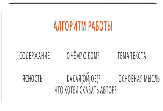
Рис.3. Алгоритм работы